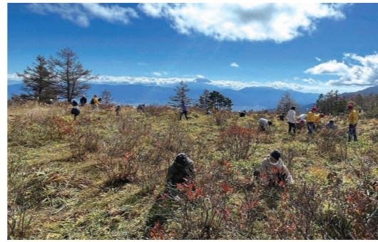
レンゲツツジの草刈り「甘利山クリーン大作戦」

甘利山では市民ボランティアを中心に、 希少な植生や景観を 次世代に紡ぐ活動を行っています。