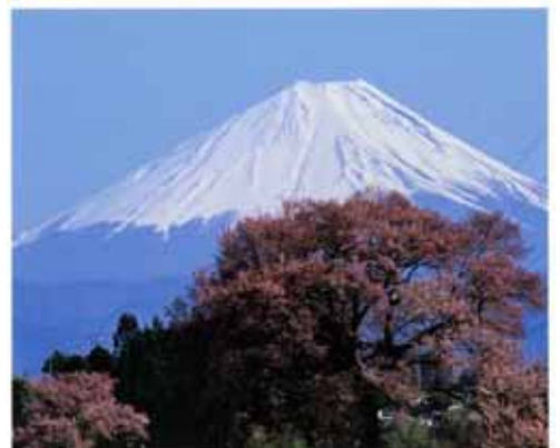
第11回 荊崎の四季フォトコンテスト 推薦作品 “わに塚の桜と富士”